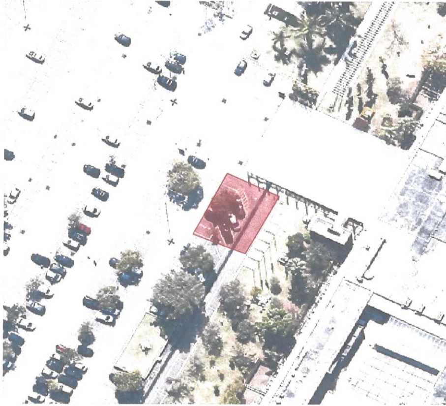
VISTA AÉREA DA ÁREA